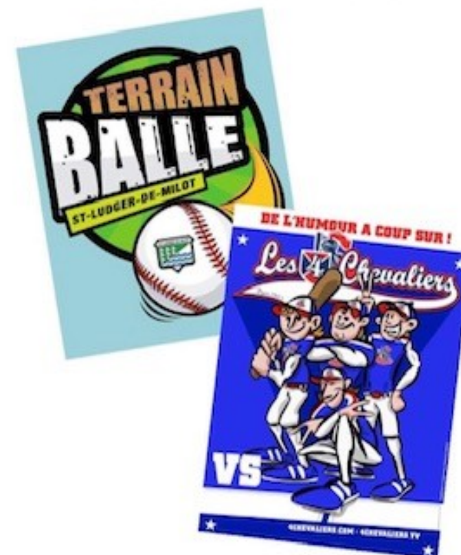
Terrain de balle, 740 Rue Duchesse, Saint-Ludger-de-Milot